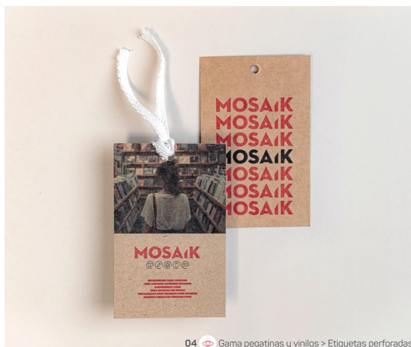
04 Gama pegatinas y vinilos > Etiquetas perforadas