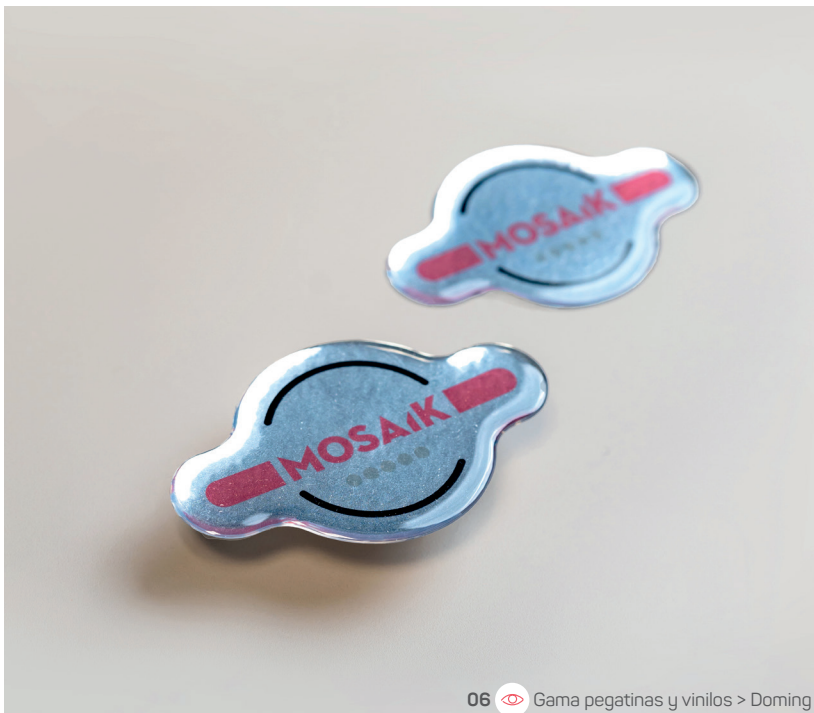
06 Gama pegatinas y vinilos > Doming