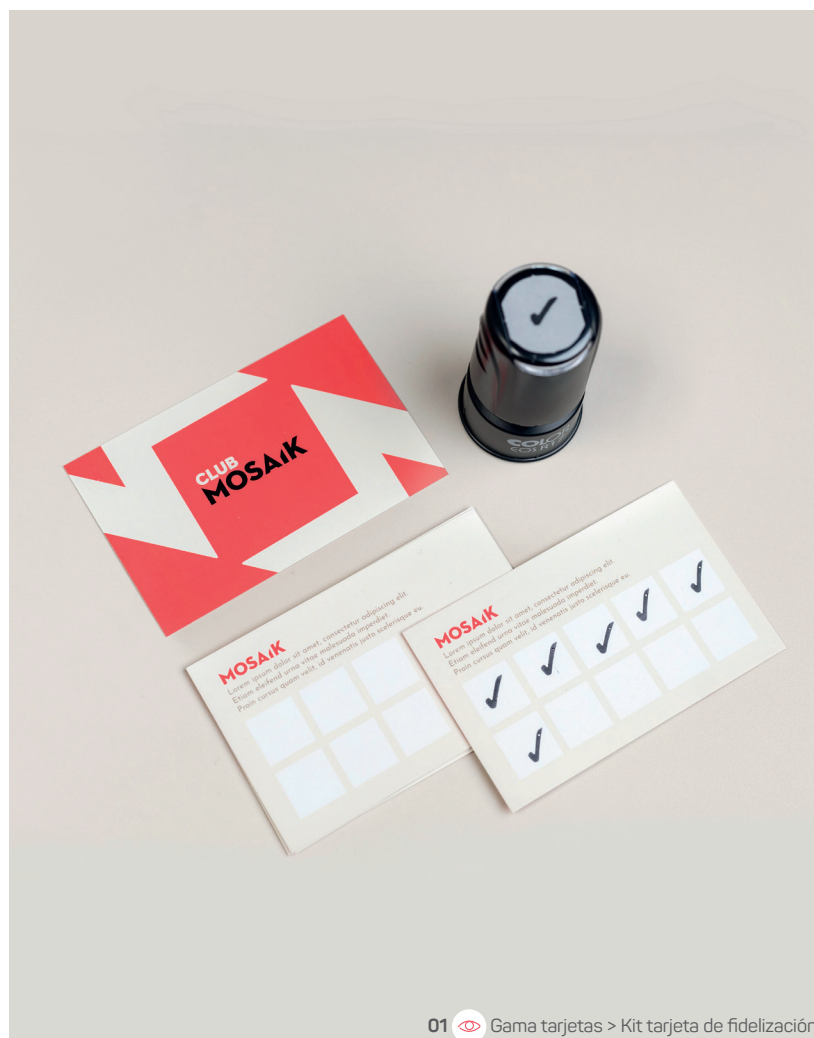
01 Gama tarjetas > Kit tarjeta de fidelización