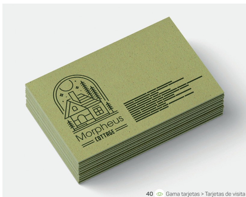
40 Gama tarjetas > Tarjetas de visita