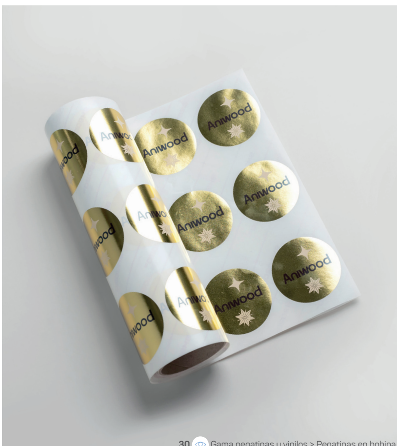
30 Gama pegatinas y vinilos &gt; Pegatinas en bobina

7 x 7 x 20 cm 380g cartón blanco Cuatri 1 cara + barniz 3D