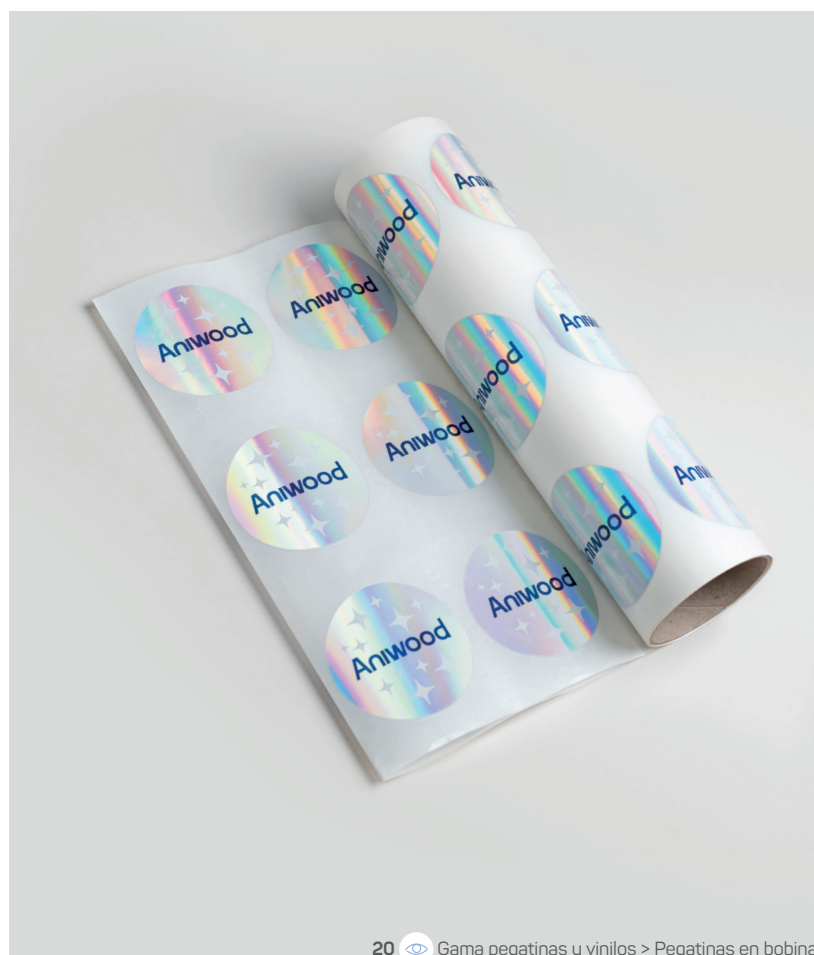
20 Gama pegatinas y vinilos > Pegatinas en bobina

Redonda 8 cm 150μ polipropileno holográfico metalizado Cuatri + blanco selectivo