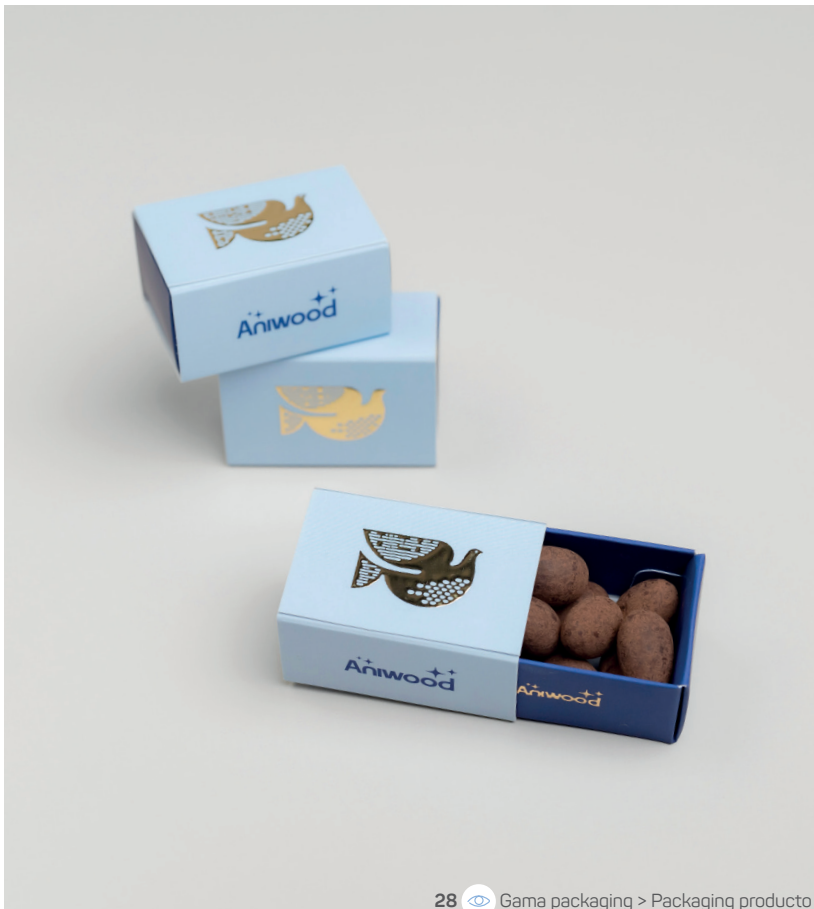
28 Gama packaging &gt; Packaging producto