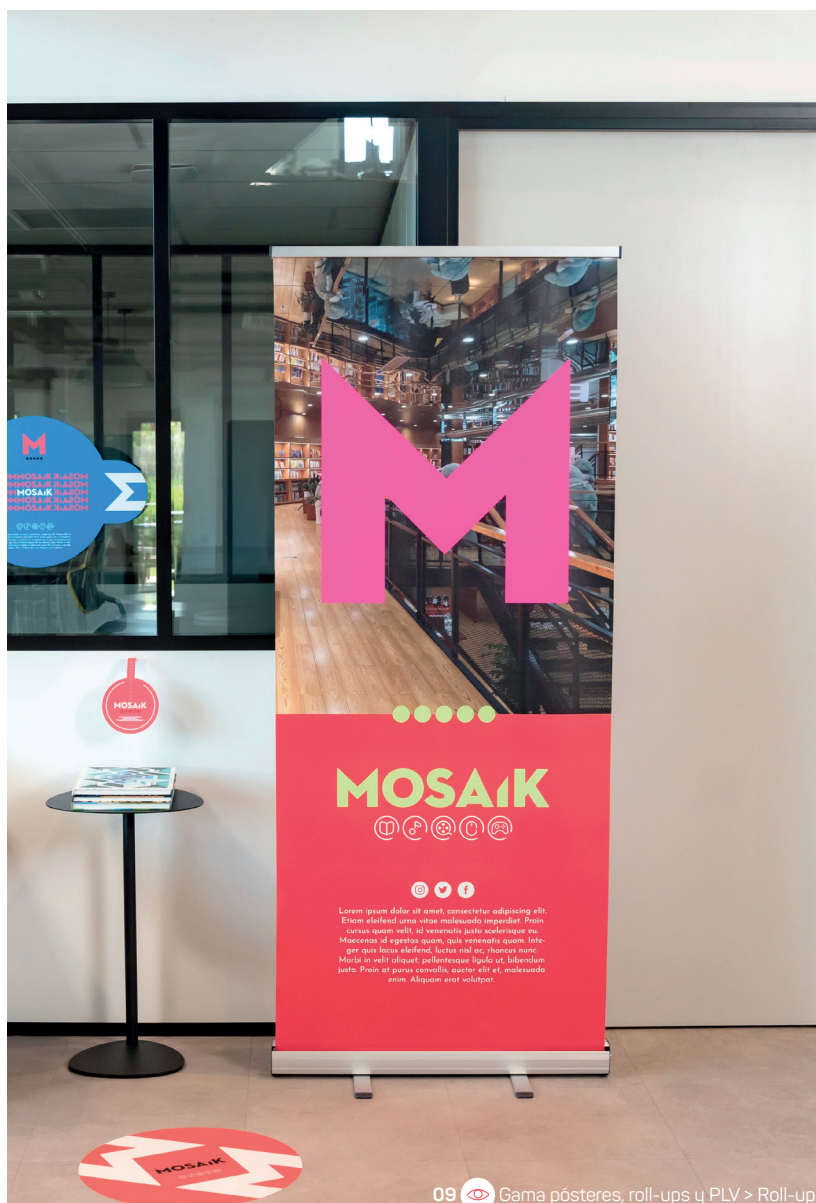
09 Gama pósteres, roll-ups y PLV > Roll-up