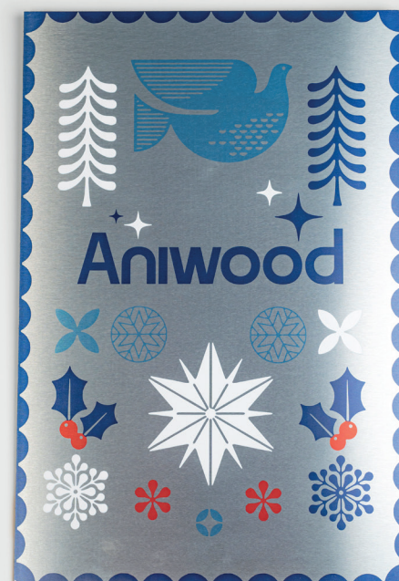
24 Gama gran formato > Paneles rígidos y accesorios