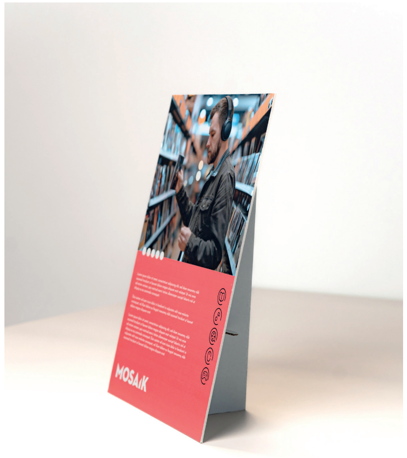
05 Gama pósteres, roll-ups y PLV > Expositores y PLV de mostrador