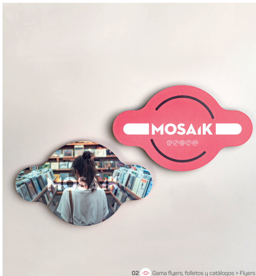
02 Gama flyers, folletos y catálogos > Flyers

En el sector retail, cada detalle cuenta para construir una relación duradera con el cliente. Un catálogo cuidado, un flyer original o una tarjeta de fidelidad bien diseñada refuerzan la credibilidad de un espacio y la calidad percibida de su oferta. Ofrece una experiencia coherente y sofisticada desde el primer contacto.