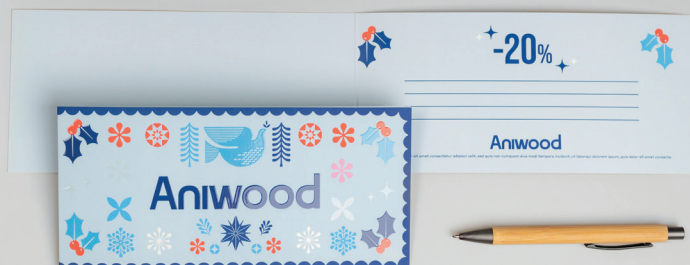
23 Gama tarjetas > Tarjetas de invitación