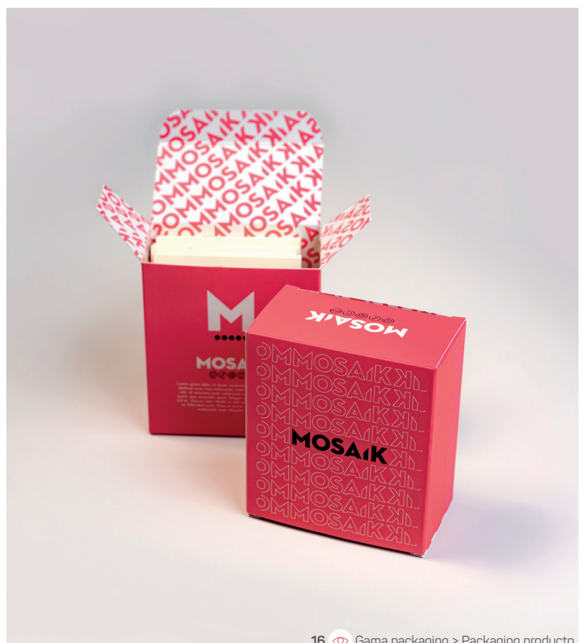
16 Gama packaging &gt; Packaging producto