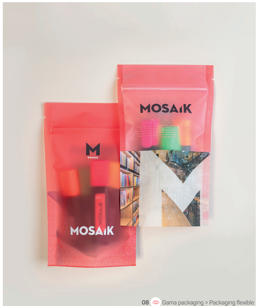
08 Gama packaging > Packaging flexible