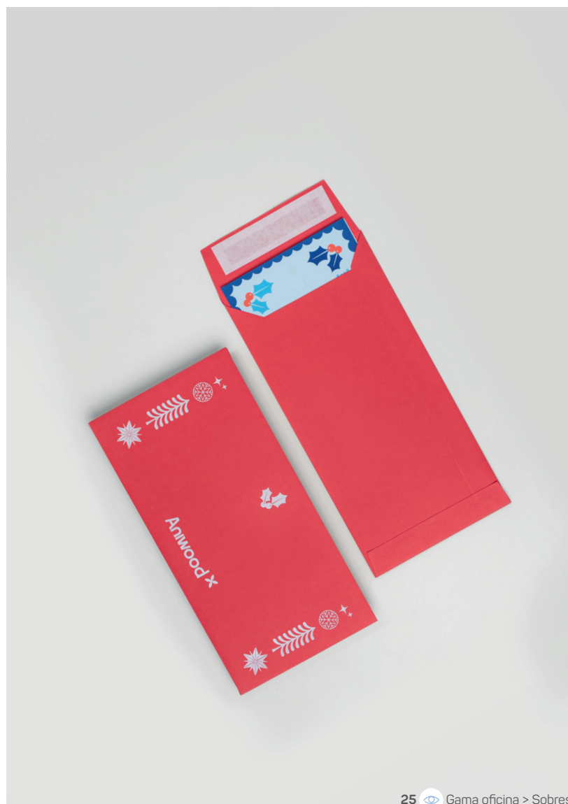
25 Gama oficina > Sobres