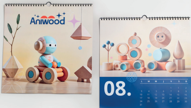
22 Gama oficina > Calendarios