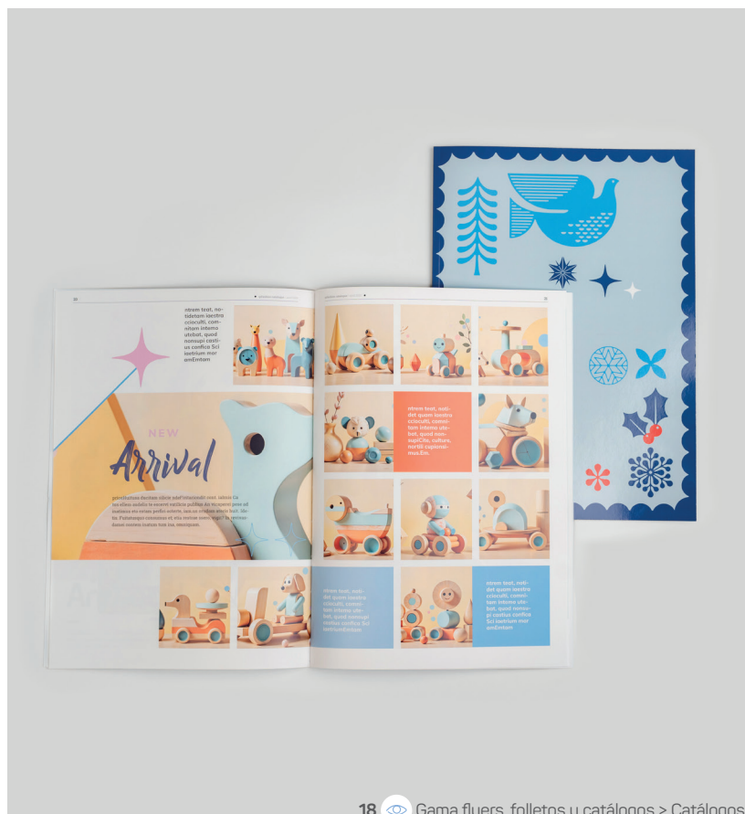
18 Gama flyers, folletos y catálogos > Catálogos

El final del año es un momento clave para dar valor a tus productos, fidelizar a tus clientes o dejar huella con un detalle cuidado. Ya sea con un packaging personalizado, tarjetas de felicitación elegantes u objetos para regalar, los soportes impresos transmiten emoción, imagen y recuerdo. Por eso, son el aliado perfecto para comunicar y conectar de manera auténtica.