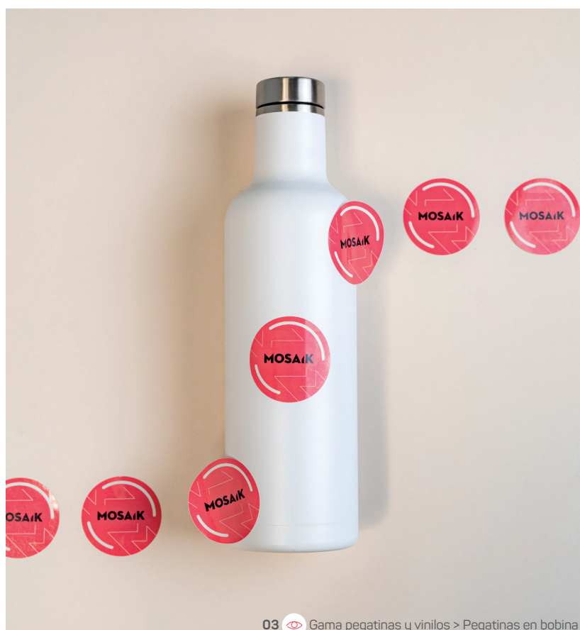
03 Gama pegatinas y vinilos > Pegatinas en bobina

8,5 x 5,4 cm 300g kraft perforación de 4 mm Cuatri 2 caras