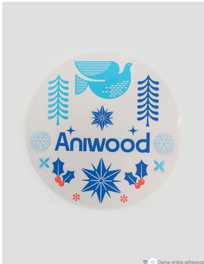
17 Gama vinilos adhesivos