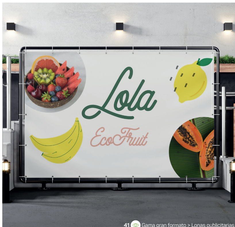
41 Gama gran formato > Lonas publicitarias