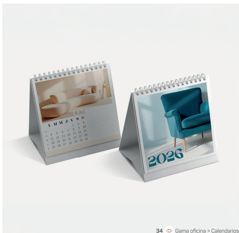
34 Gama oficina > Calendarios