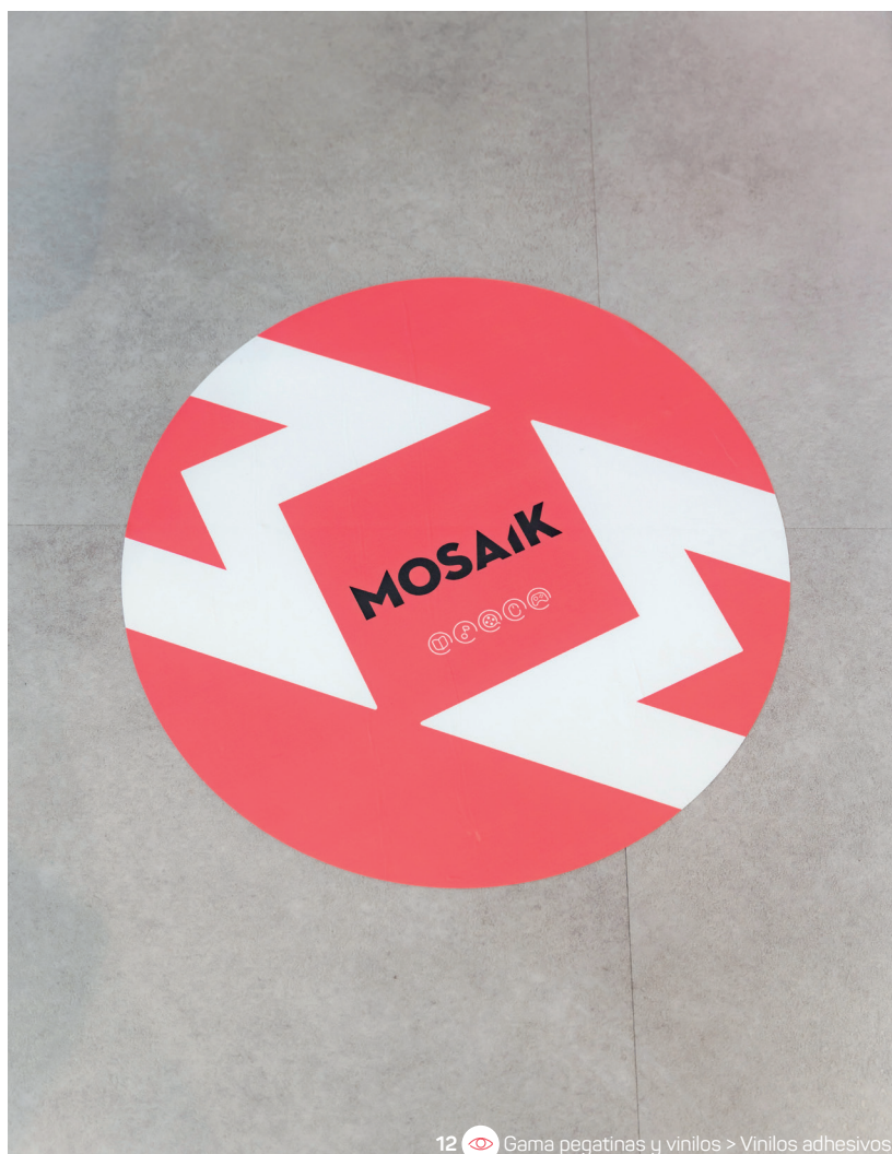
12 Gama pegatinas y vinilos > Vinilos adhesivos