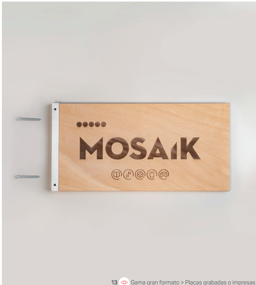
13 Gama gran formato &gt; Placas grabadas o impresas