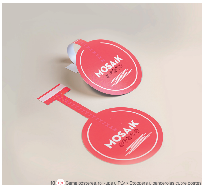
10 Gama pósteres, roll-ups y PLV > Stoppers y banderolas cubre postes

Fuente: FedEx Office – Consumer Printing Survey, 2023