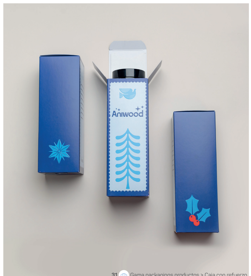
31 Gama packagings productos &gt; Caja con refuerzo