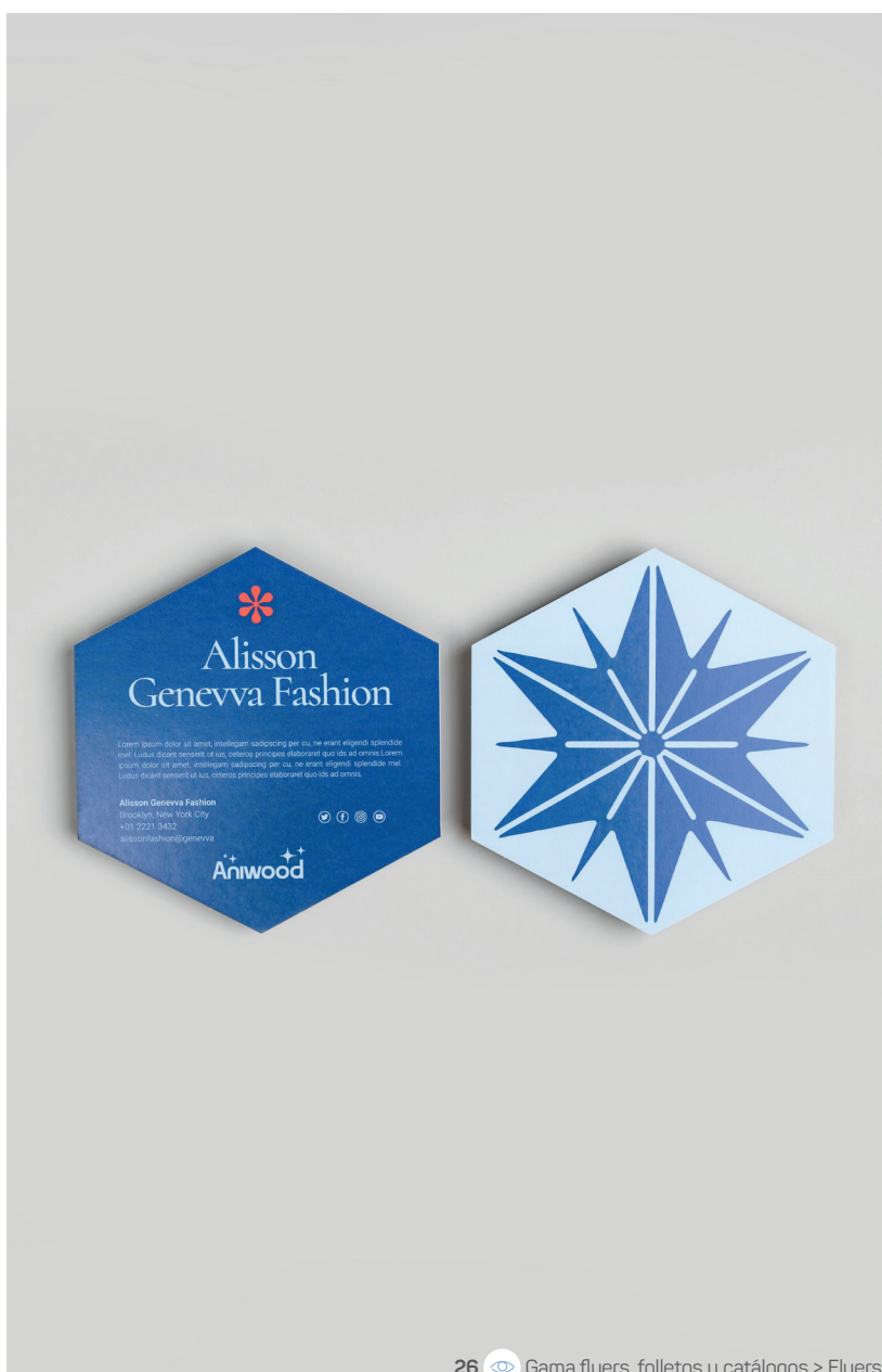
26 Gama flyers, folletos y catálogos > Flyers