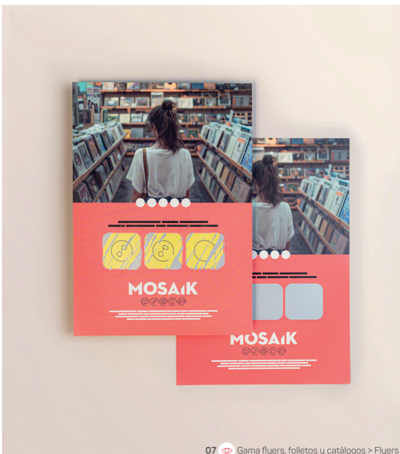
07 Gama flyers, folletos y catálogos > Flyers