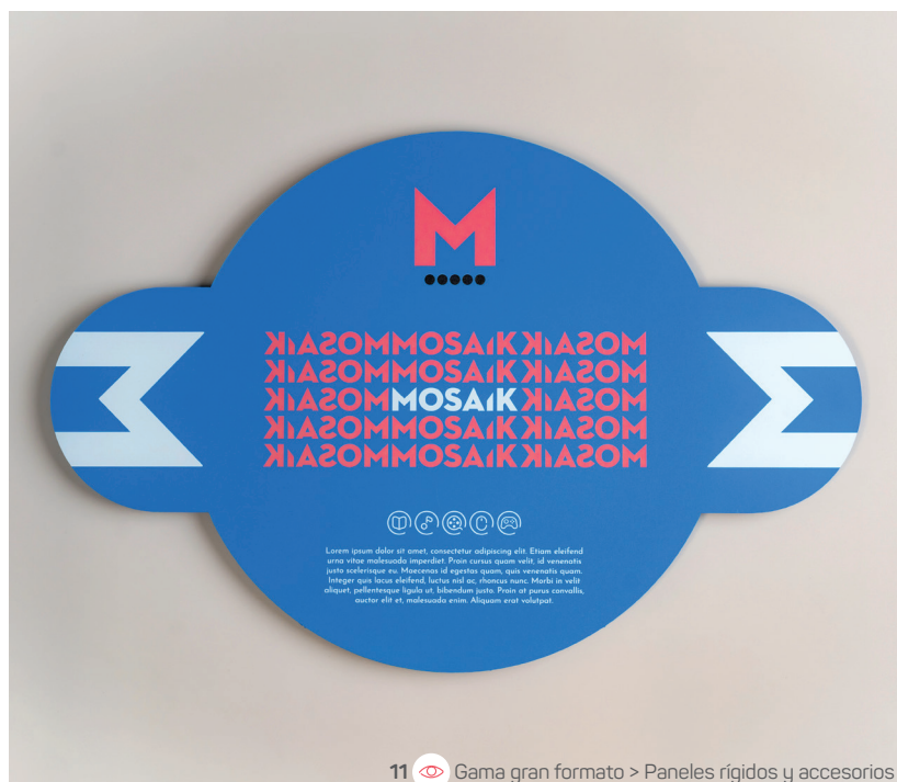
11 Gama gran formato > Paneles rígidos y accesorios