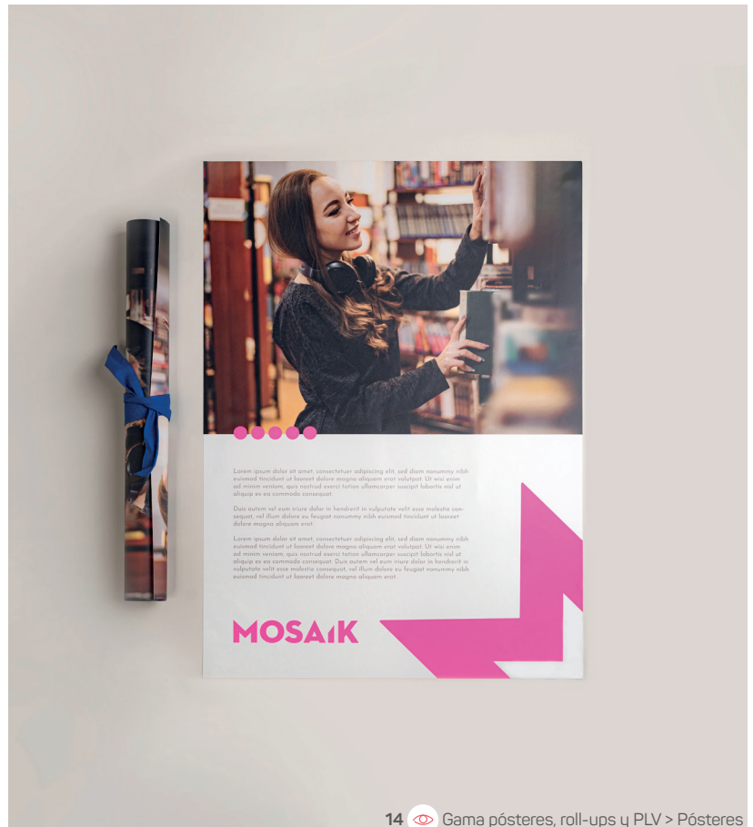
14 Gama pósteres, roll-ups y PLV &gt; Pósteres

EL 83 % de las decisiones de compra se toman directamente en el punto de venta. La experiencia en tienda sigue siendo determinante: la atmósfera, la claridad de la oferta y la coherencia visual influyen en la decisión final, mucho más allá del propio producto.