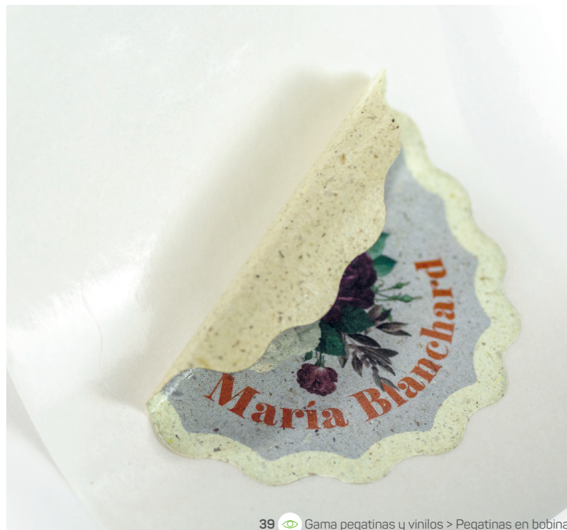
39 Gama pegatinas y vinilos > Pegatinas en bobina

Sostenibilidad rima con creatividad. Estos soportes son ecológicos: papel de fibras vegetales, vinilo sin PVC, tarjetas en papeles reciclables o lonas diseñadas ecológicamente. La identidad visual también pasa por la elección de los materiales. Estos productos reciclados realzan tu identidad y tus valores.