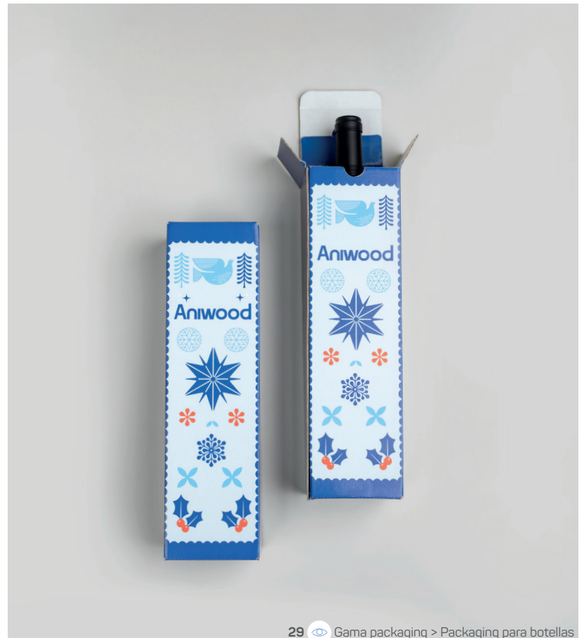
29 Gama packaging &gt; Packaging para botellas