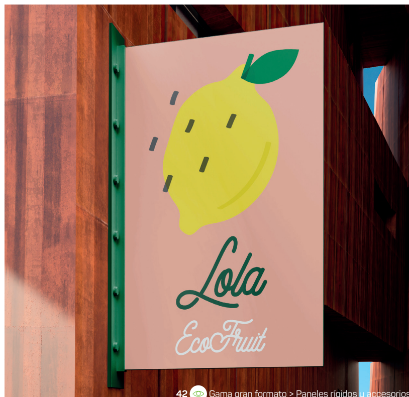
42 Gama gran formato > Paneles rígidos y accesorios

39 / PEGATINA EN BOBINA 3 x 3 cm forma personalizada 90g papel de fibras vegetales