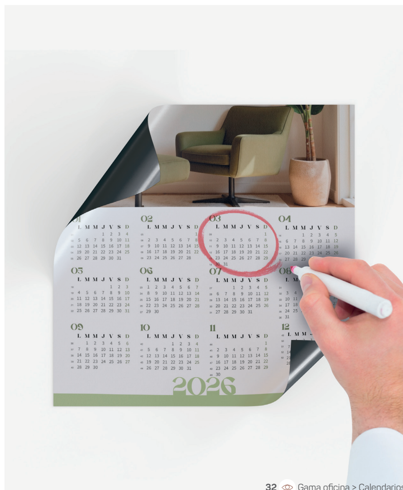
32 Gama oficina > Calendarios