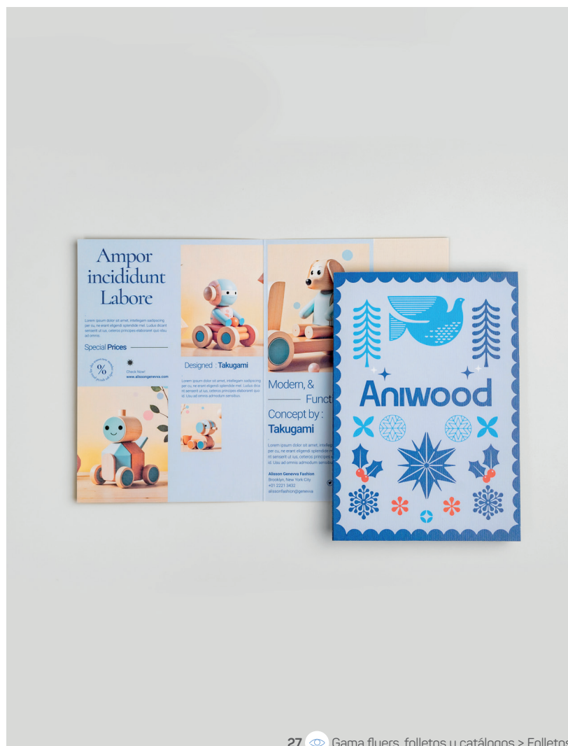
27 Gama flyers, folletos y catálogos > Folletos

25 / SOBRE PAPEL ESPECIAL 11 x 22 cm 120g papel color rojo Blanco selectivo 1 cara Banda adhesiva