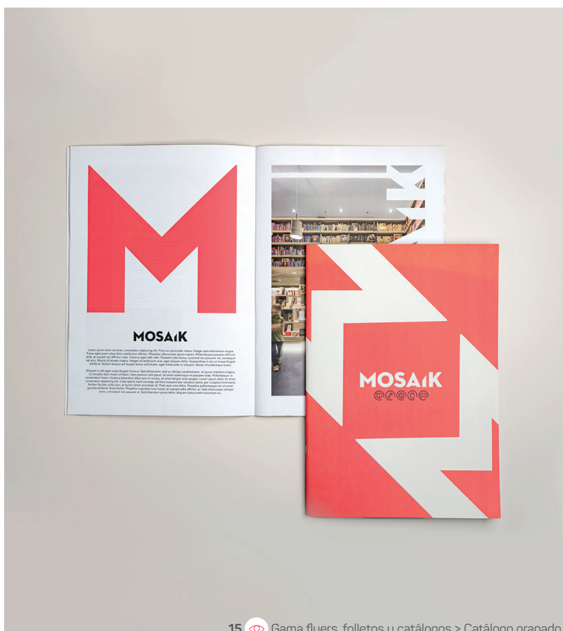
15 Gama flyers, folletos y catálogos &gt; Catálogo grapado

9 x 5 x 10 cm 400g cartón blanco semimate Plastificado mate Soft Touch 1 cara Cuatri 2 caras