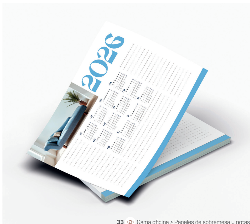
33 Gama oficina > Papeles de sobremesa y notas

El calendario es un objeto útil del día a día que sigue siendo indispensable. Ya sea para colgar en la pared, en el escritorio o en formato caballete, en espiral o en bloc, se adapta a todos los entornos y puede convertirse en un verdadero soporte de comunicación. Personalizado o impreso, cada modelo permite dejar huella los 365 días del año.